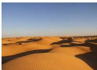
Désert 📍 Douz 📍