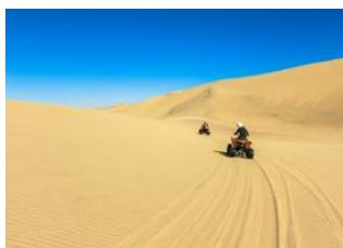
Djerba 📍 🚗 210km - ⌚ 4h Douz 📍 Désert 📍