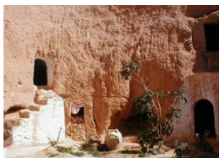
Douz 📍 🚗 90km - ⌚ 1h 30m Matmata 📍 🚗 130km - ⌚ 2h 45m Djerba 📍