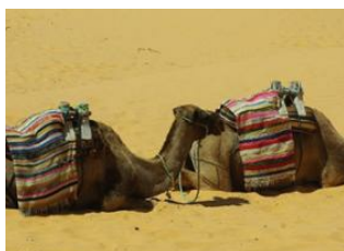
Désert 📍 Douz 📍